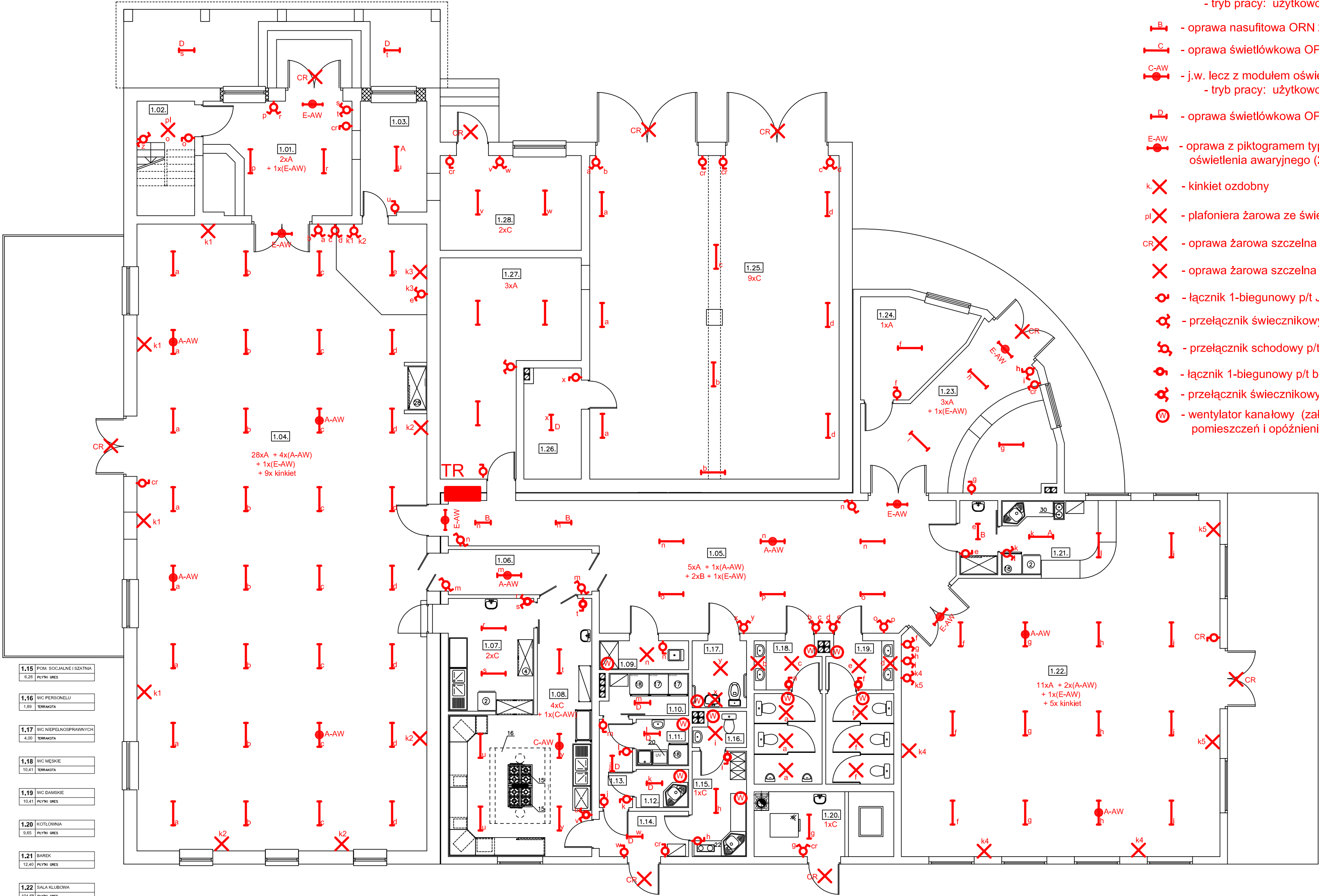
Schemat połączeń opraw z czujnikami ruchu: